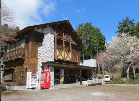
写真: Bパック 研修棟