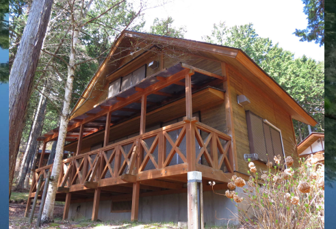
写真: Aパック コテージ