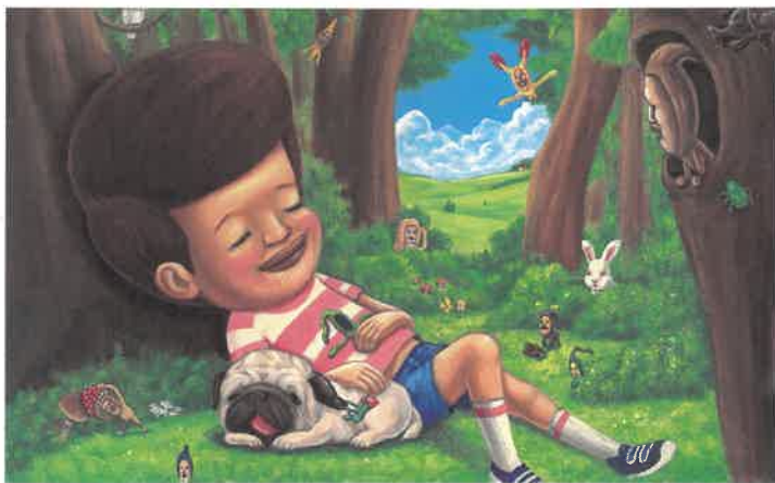
「こびとづかん」より