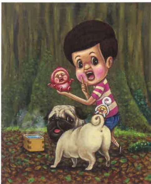
「こびとと桃がたり」より