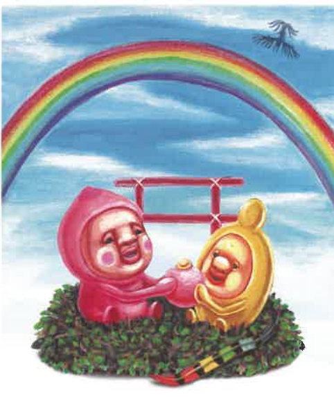
「こびとと桃がたり」より