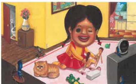
「みんなのこびと」より

何も無いのに音がしたり、ふと気配を感じるのはコビトがそこにいるから!?…かもしれません。ふしぎな、でも身近なコビトの世界をお楽しみください。