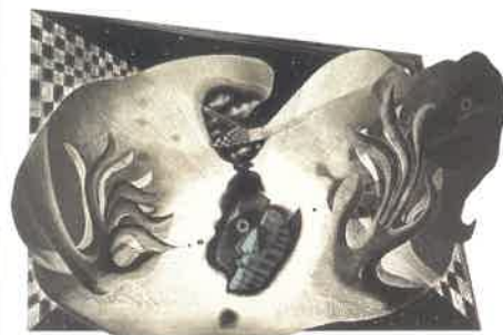
《モクテスマの苦悩》銅版画 1981年