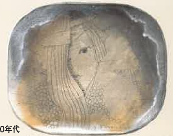
《線刻 中原中也の幻想》陶 1990年代

本展では、2006(平成18)年に、作家より当館に寄贈された400点余の作品の中から、銅版画をはじめ、パステル画、書、ガラス絵、陶芸など、約60点を展示し、作家の仕事をご紹介します。