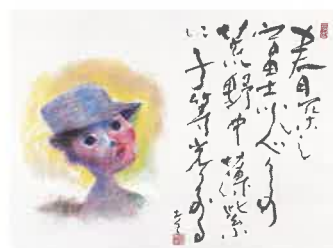
《春の富士川》パステル・書 1945年