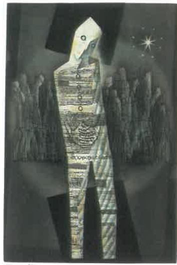
《黄昏銀座》銅版画 2000年