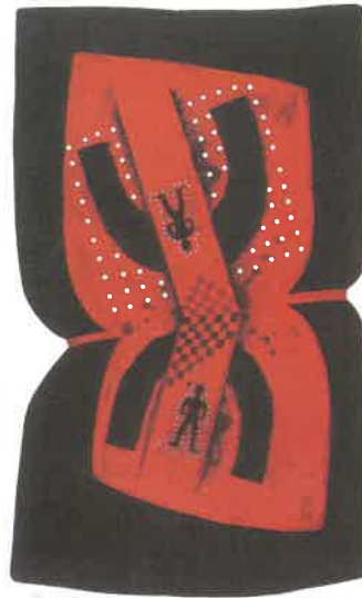
《行きずりの人(黒)》銅版画 1967年