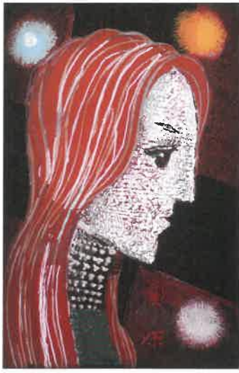
《火花 プロフィール》ガラス絵 2003年