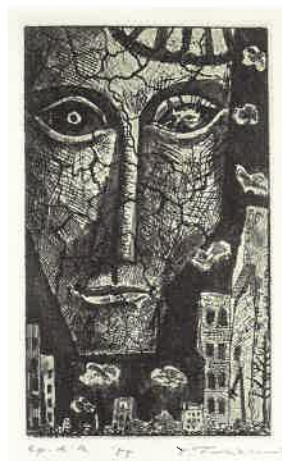
《廢墟の貌》銅版画 1955年