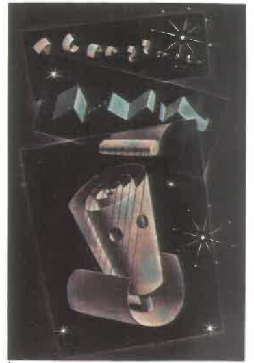
《弦楽の響きの中で》銅版画 1996年