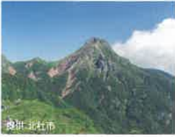
赤岳 (八ヶ岳) 2,899m 八ヶ岳連峰の最高峰。 山頂からの展望は抜群。 最寄りIC:小淵沢・長坂 北杜市観光課 0551-42-1351