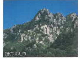
瑞牆山 2,230m 全山が花崗岩で形成された岩峰。 トサカ岩等の数多くの奇岩が並びます。 最寄りIC:須玉 北杜市観光課 0551-42-1351