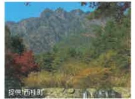
三ツ峠山 1,785m 富士山の展望、高山植物等で有名。 石仏群もあり、信仰の山であった。 最寄りIC:都留・河口湖 西桂町産業振興課 0555-25-2121(代) 富士河口湖町観光課 0555-72-3168 都留市観光協会 0554-43-1111(代)