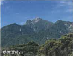
甲斐駒ヶ岳 2,967m 花崗岩から成り山肌が白く輝く。 駒ヶ岳と名の付く山の最高峰。 最寄りIC:白根・南アルプス 北杜市観光課 0551-42-1351