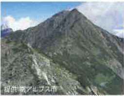
北岳 3,193m 富士山に次ぐ日本第二位の高峰。 固有種の高山植物キタダケソウが自生しています。 最寄りIC:白根・南アルプス 南アルプス市観光施設課 055-282-6294