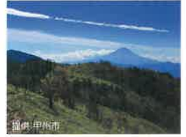
大菩薩嶺 2,057m 富士山をはじめ様々な山を展望出来ます。 大菩薩連峰の盟主である。 最寄りIC:大月・勝沼 甲州市観光商工課 0553-32-5091 小菅村観光振興課 0428-87-0111(代) 丹波山村振興課 0428-88-0211(代)