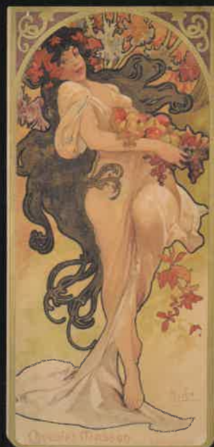
アルフォンス・ミュシャ《春》と《秋》マッソンチョコレート1897年カレンダー用のリトグラフ 1896年 リトグラフ

開館時間／午前9時30分～午後5時(入館は午後4時30分まで) 休館日／9月4日(月)、11日(月)、19日(火)、25日(月)、10月2日(月)、10日(火)、16日(月)、23日(月)、30日(月) 企画協力／E.M.Iネットワーク 後援／NHK甲府放送局、山梨日日新聞社、山梨放送、テレビ山梨、 朝日新聞甲府総局、毎日新聞甲府支局、読売新聞甲府支局、産経新聞甲府支局、 時事通信社甲府支局、山梨新報社、エフエム富士、エフエム甲府、日本ネットワークサービス、 峡西CATV、白根ケーブルネットワーク、富士川CATV 入館料／一般500(400)円・大高生300(240)円・中小生200(160)円 ( )内20名以上団体割引料金