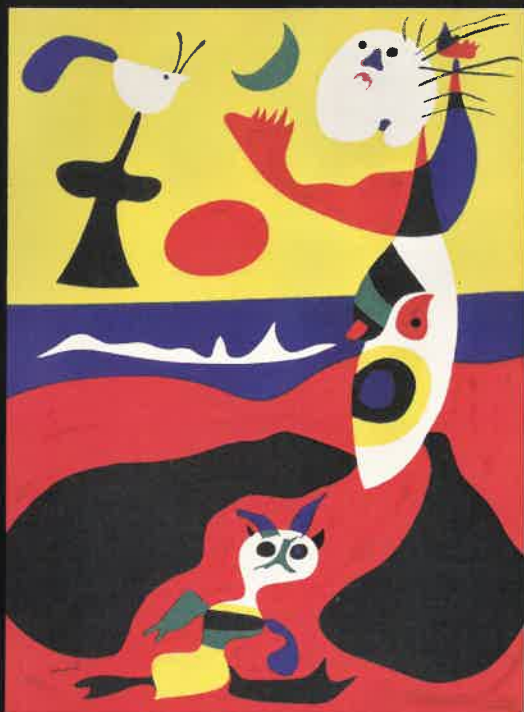
ジョアン・ミロ《夏》 美術文芸誌「ヴェルヴ」3号に収録 1938年 リトグラフ E5279