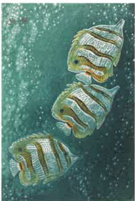
《ちょうちょううお》