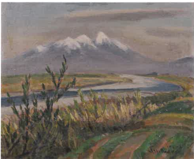
内田一郎《富士川のハツ岳》