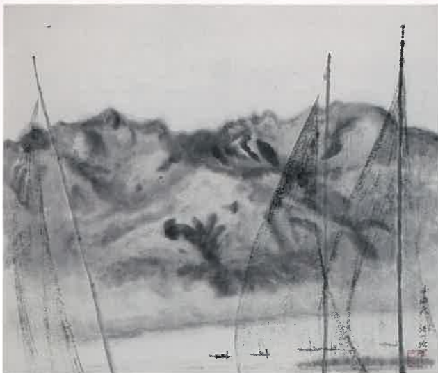
近藤浩一路《網干し》