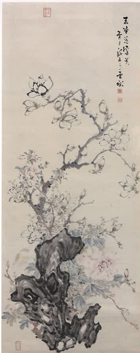
三枝雲岱《玉堂富貴》