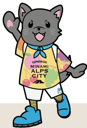
南アルプス かいまる

天然記念物登録されている甲斐犬の「kai」、南アルプスの英語表記「minami alps」の1・7・8文字目を繋いだ「mal」を平仮名表記したもの。愛称は「かいまる」