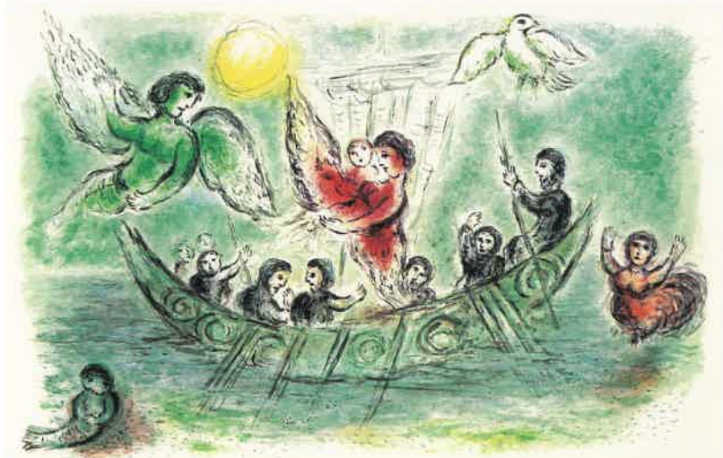
《セイレンたち》【オデッセイ】より 1975年刊 リトグラフ 42.7×32.8cm