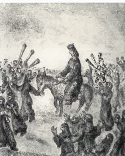
《ソロモン王の塗油礼》『バイブル』より 1966年刊 エッチング 30.0×24.5cm

© ADAGP, Paris & JASPAR, Tokyo, 2022. Chagall® E4740