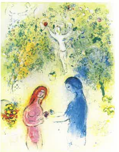
《挿絵》『ダフニスとクロエ』より 1961年刊 リトグラフ 42.2×31.8cm