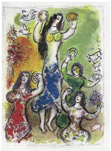
《そしてアロンの姉にして預言者イザヤはタンバリンを手に取り打ち鳴らした。彼女に続き、すべての女たちはタンバリンを持ち踊りながら彼女についていった。》【出エジプト記】より 1966年刊 リトグラフ 48.0×33.3cm

日時：10月8日（土）・9日（日）・15日（土） 9日は午後のみ 午前10時～、午後2時～ 場所：美術館展示室 参加料：入館料に含む