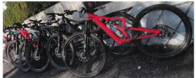
Specialized Turbo Levo SL 10台 Santa Cruz Heckler 1台