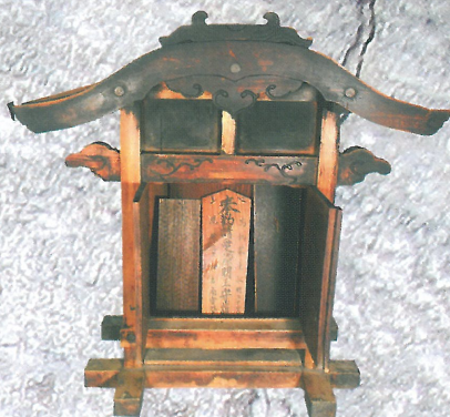
愛染明王お札と厨子(個人蔵)