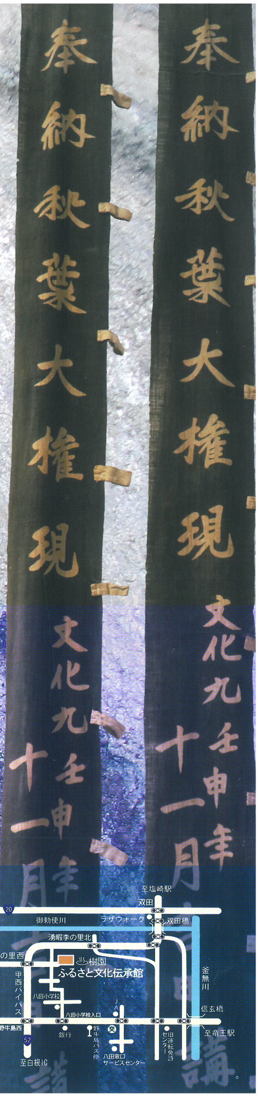
文化九年十日市場秋葉大権現幟旗 (南アルプス市文化財課蔵)