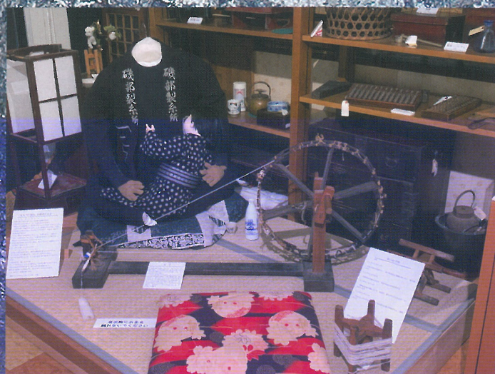
『夜なべ仕事は、行燈消すまで...』