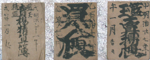
藍玉関係史料(個人蔵)