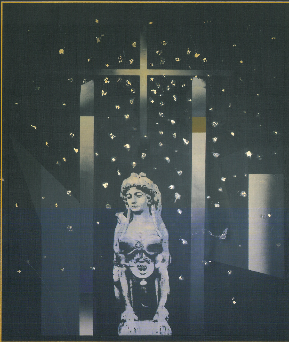
《冬のスフィンクス》 2011年 個人蔵