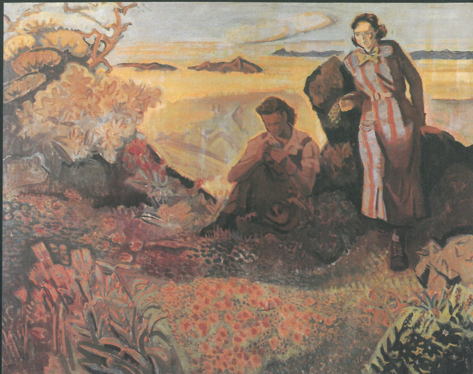
土橋芳次《春の丘憩う娘たち》