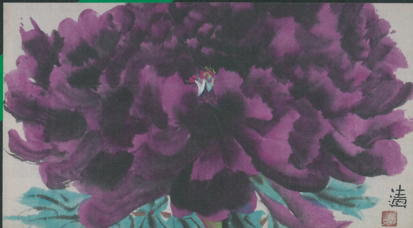
のむら清六《紅牡丹》

令和3年10月16日(土)～令和4年1月16日(日) 〔前期:10月16日(土)～11月28日(日)／後期:12月1日(水)～令和4年1月16日(日)〕