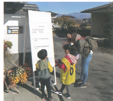
▲ 昨年のウォークラリー大会（若草地区）での様子 ▲