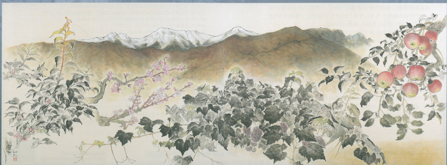
《南アルプス 果樹の四季》2009年

開館時間／午前9時30分～午後5時(入館は午後4時30分まで) 休館日／9月6日(月)、13日(月)、21日(火)、24日(金)、27日(月) 10月4日(月)