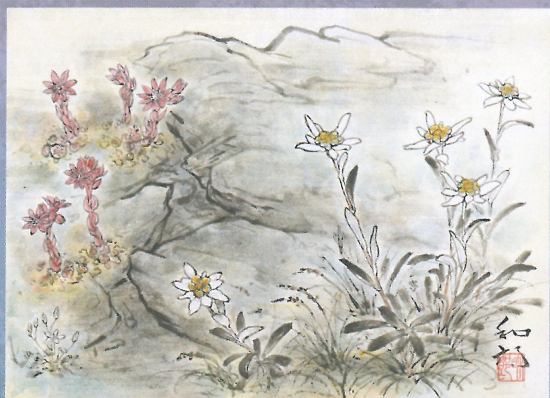
《岩場のエーデルワイスやセンペルビウムモンタナム》2000年