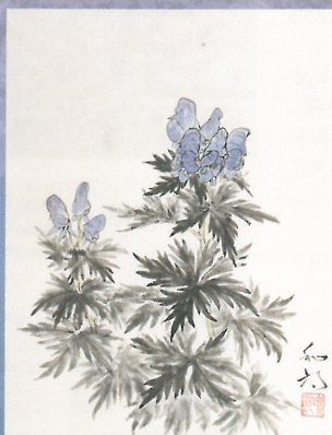
《キタダケトリカブト》2003年